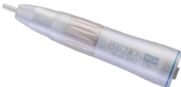
CHRONO 11 - recto 1:1 Cód. PRCR0011